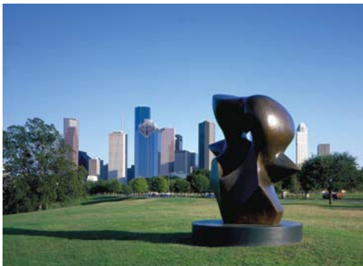
Greater Houston CVB