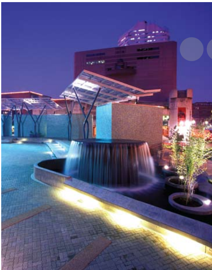
Greater Houston CVB